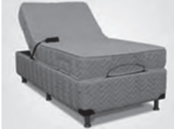
Figura 1 – Cama articulada com uma secção inclinada

No esquema da Figura 2, está representada a vista lateral de uma cama articulada, com o topo encostado a uma das paredes de um quarto. Nesse esquema, o trapézio [ABCD] representa a secção inclinada da cama e o retângulo [FGHI] representa a base da cama.