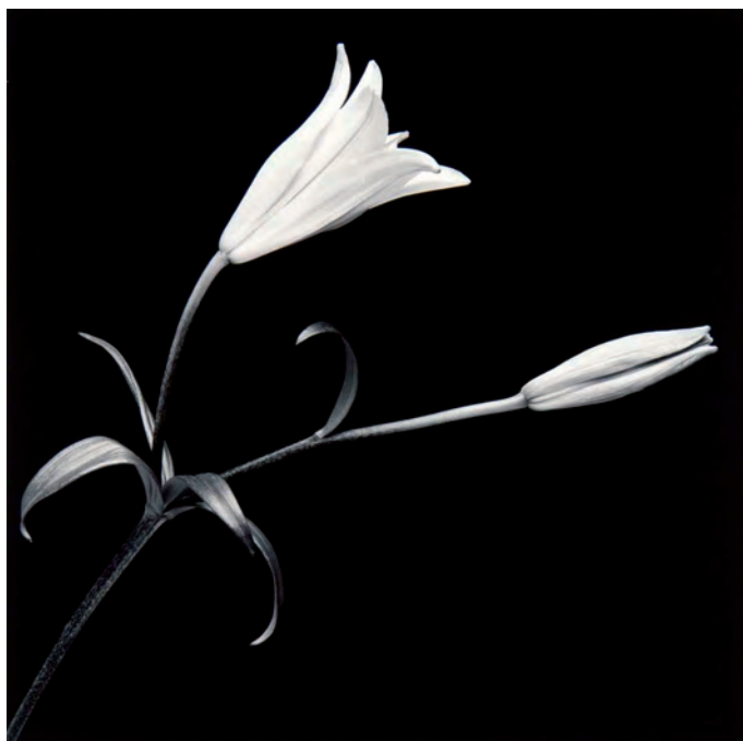
Figura 3 – Robert Mapplethorpe, Lily with Bud , 1989.