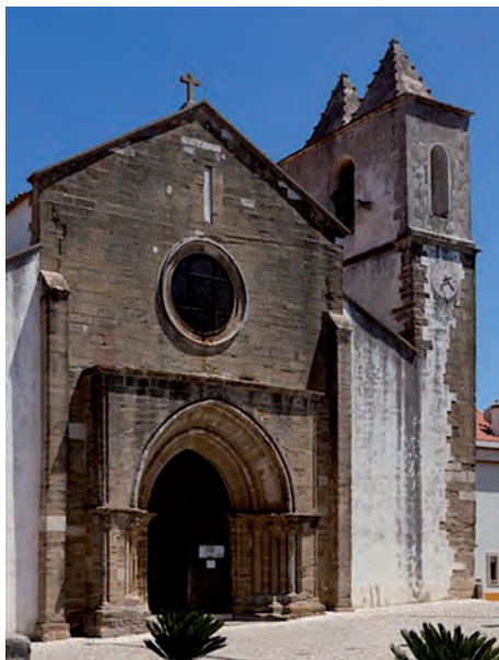
Figura 2 – Igreja de S. Leonardo, Atouguia da Baleia, séculos XIII-XIV