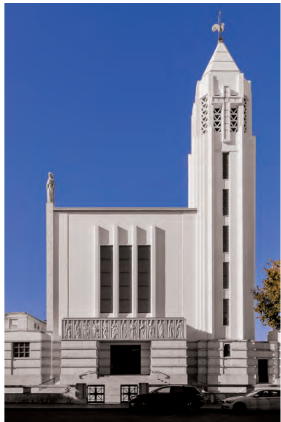
Porfírio Pardal Monteiro, Igreja de Nossa Senhora de Fátima , Lisboa, 1934-1938