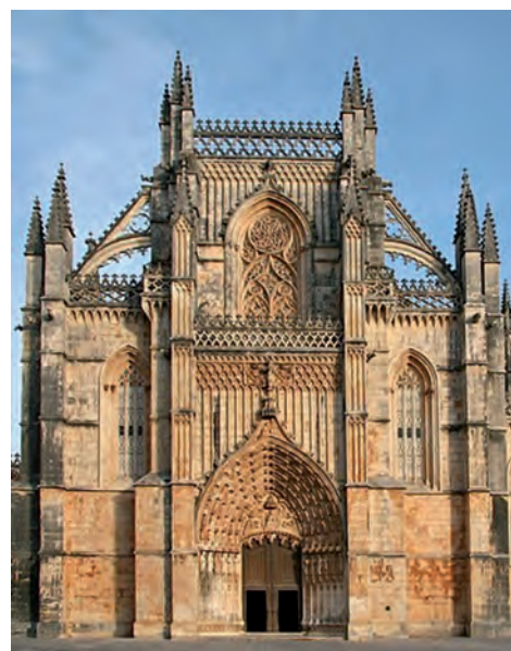
Figura 3 – Igreja de Santa Maria da Vitória, Batalha, séculos XIV-XV

* 2.1. O período de «consolidação da estética gótica» (Texto B) está fundamentalmente associado