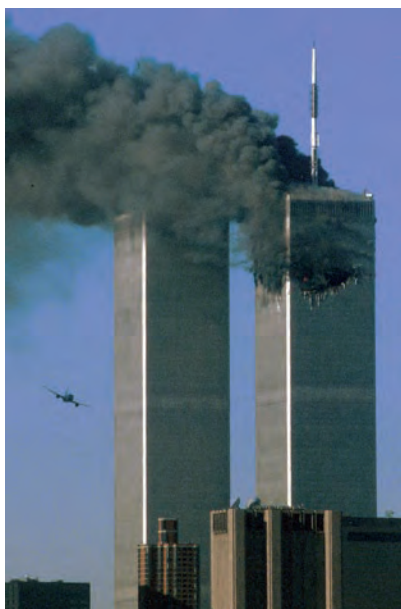
A – Pormenor do ataque terrorista ao World Trade Center , em Nova Iorque (EUA).