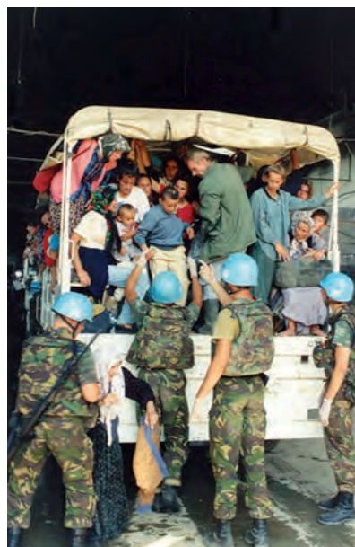
B – Apoio da ONU a refugiados bósnios aquando do massacre de Srebrenica, na ex-Jugoslávia.