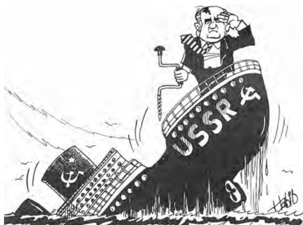
D – «A URSS afunda-se»: a perspetiva do cartoonista libanês Habib Haddad.