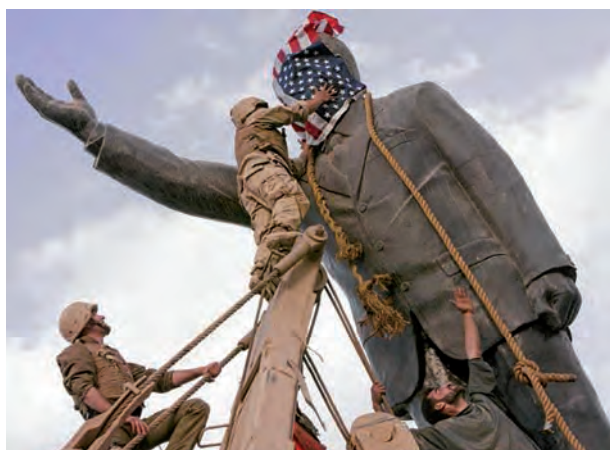
C – Derrube, em Bagdade, de uma estátua do presidente do Iraque, Saddam Hussein.